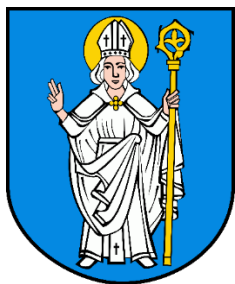
Herb Rzgowa i Gminy Rzgów