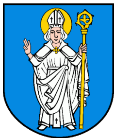
Flaga Gminy Rzgów